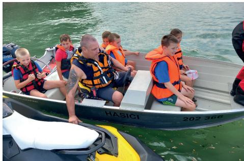
Vedoucí a děti z SDH Velká Jesenice

Pravidelné setkávání v novém školním roce jsme zahájili výletem na přehradu Rozkoš. Seznámili jsme se s výbavou a prací hasičů na vodě a za odměnu se projeli na hasičském člunu. V říjnu jsme mezi sebe přivítali nové tváře, a tak má naše „jednotka“ mladých hasičů už 20 členů. V předvánočním čase jsme si našli chvíli i na tvoření. Vytvořili jsme pár adventních dekorací a svícnů, které jsme prodávali na 3. ročníku Soutěže o nejlepší bramborový salát. Nezbylo nám skoro nic, za což všem patří obrovské poděkování. Celá částka bude použita na činnost mladých hasičů. Pokud nám zdraví dovolí, rádi bychom se do konce listopadu zúčastnili přátelského utkání s mladými hasiči v Novém Městě nad Metují a začátkem prosince nás čeká první velká soutěž, a to Mikulášské klání ve Rtyni v Podkrkonoší. Přejeme všem krásné prožití svátků vánočních a mnoho zdraví v novém roce 2024.